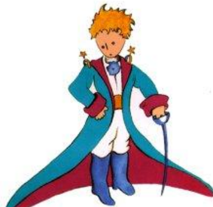
Aquí tienen el mejor retrato que más tarde logré hacer de él

Me puse en pie de un salto como herido por el rayo. Me froté los ojos. Miré a mi alrededor. Vi a un extraordinario muchachito que me miraba gravemente. Ahí tienen el mejor retrato que más tarde logré hacer de él, aunque mi dibujo, ciertamente es menos encantador que el modelo. Pero no es mía la culpa. Las personas mayores me desanimaron de mi carrera de pintor a la edad de seis años y no había aprendido a dibujar otra cosa que boas cerradas y boas abiertas.